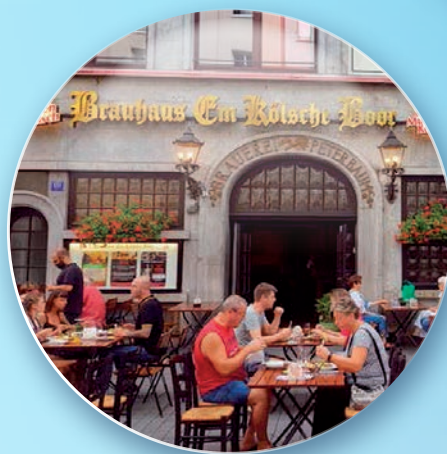
Netzwerken bei einem Brauhausbesuch