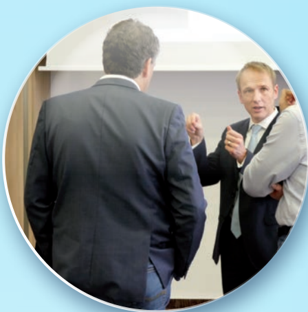
21 spannende Vorträge und Fachforen